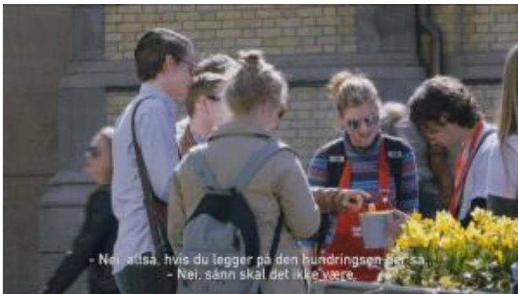
Stillbilde fra skjult kamera-filmen hvor bøssebæreren gir tilbake mer penger enn giveren putter på.

Til tross for intenst press fra SLUG stemte Norge igjen avholdende og legger med det ned den tverrpolitiske enigheten om at gjeldsslette er riktig tiltak for å skape økonomisk vekst. Norge har vært et foregangsland på dette feltet og i Regjeringens plattform (Sundvollen-erklæringen, 7. oktober 2013) står det Regjeringen vil «bidra til gjeldsslette for fattige land gjennom både internasjonale og bilaterale avtaler». Det var derfor skuffende at Norge forholdt seg passive når flertallet av verdens stater endelig hadde entes om å utforme en upartisk og rettferdig gjeldshåndteringsmekanisme.