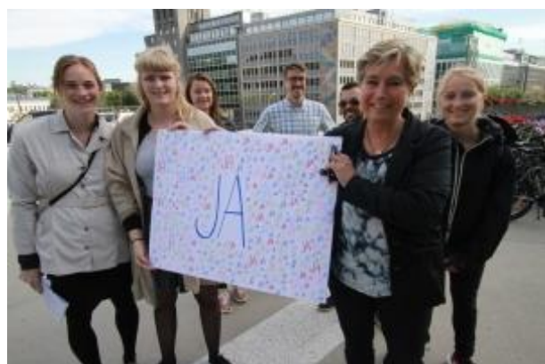
1000 «JA» til at Norge skulle stemme for resolusjonen i FNs generalforsamling i september 2015.

Den engelske versjonen ble sett over 14 000 ganger og nådde ut til over 62 000 i blant annet Belgia, Kenya, Frankrike, Sveits, Sverige, USA og Storbritannia. Videoen ble også delt og brukt av flere organisasjoner i SLUGs internasjonale nettverk.